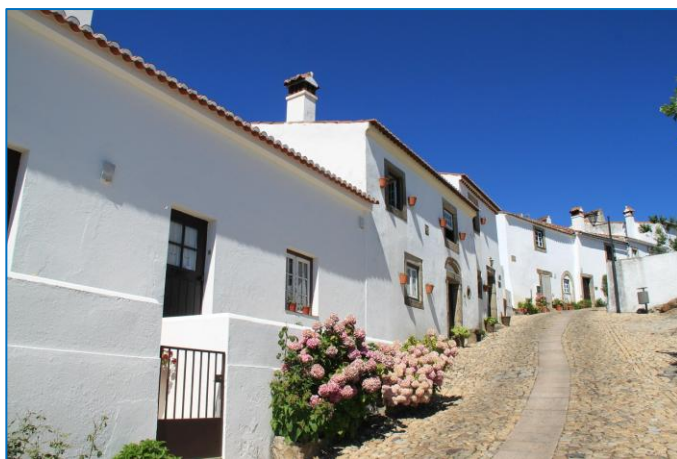
Figura 1. Casas caiadas de branco no Alentejo.

No Alentejo, é comum ver as casas pintadas de branco.