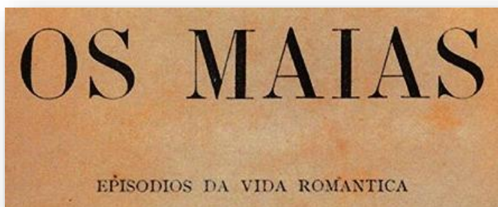
Imagem 1: detalhe de capa de Os Maias (edição de 1888).

Lê o título e o subtítulo na capa de uma edição da obra de 1888. →