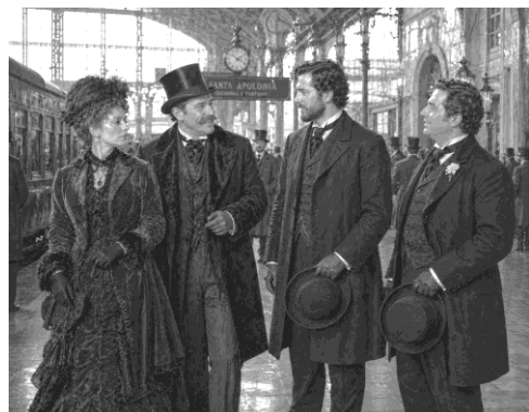
Imagens 6 - gerada por inteligência artificial. OpenAI, DALL-E.