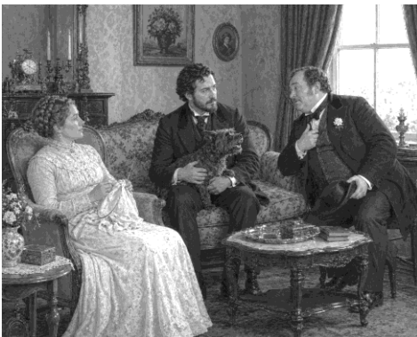
Imagens 3 - gerada por inteligência artificial. OpenAI, DALL-E.