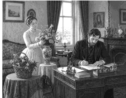
Imagens 4 - gerada por inteligência artificial. OpenAI, DALL-E.