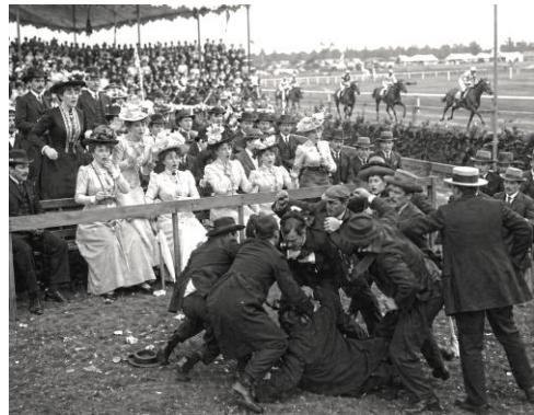
Imagens 2 - gerada por inteligência artificial. OpenAI, DALL-E.