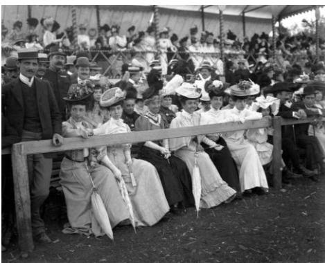
Imagens 5