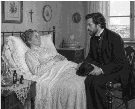
Imagens 1 - gerada por inteligência artificial. OpenAI, DALL-E.

Dentro do par ou grupo, apresentem oralmente a tarefa e negociem uma conclusão para cada imagem.