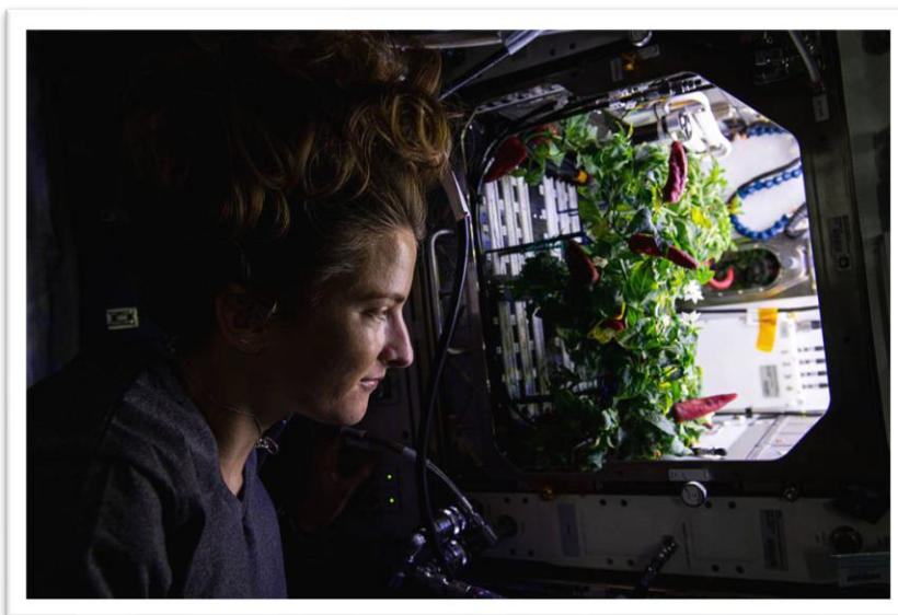
Figura 1. Plantas de pimento a crescer no Advanced Plant Habitat , a bordo da Estação Espacial Internacional ( https://www.nasa.gov ).

A astronauta Kayla Barron observa plantas de pimento a bordo da Estação Espacial Internacional. Estas plantas foram cultivadas no âmbito de uma experiência da NASA sobre o crescimento de plantas no espaço.