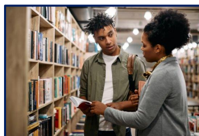
Imagem 1: biblioteca

Visita a biblioteca da tua região e consulta a programação de atividades para poderes também participar.