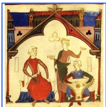
Imagem 1: Iluminura do Cancioneiro da Ajuda (Projeto Littera: https://cantigas.fcsh.unl.pt/ , em 28.10.2024)

Aqui ficam outras imagens para enriquecer a vossa discussão.