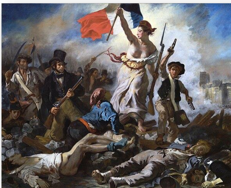
Imagem 1: E. Delacroix, (1830), A liberdade guiando o povo . Museu do Louvre, Paris