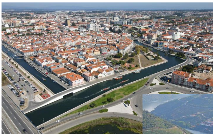
Figura 1 – Cidade de Aveiro

Analisa duas imagens que representam duas regiões: a Figura 1, a cidade de Aveiro e a Figura 2, a Vila do Pinhão. A partir da observação e comparação dessas imagens, serás desafiado a refletir sobre a relação entre o espaço rural e o espaço urbano e a questionar até que ponto essa dicotomia ainda faz sentido.