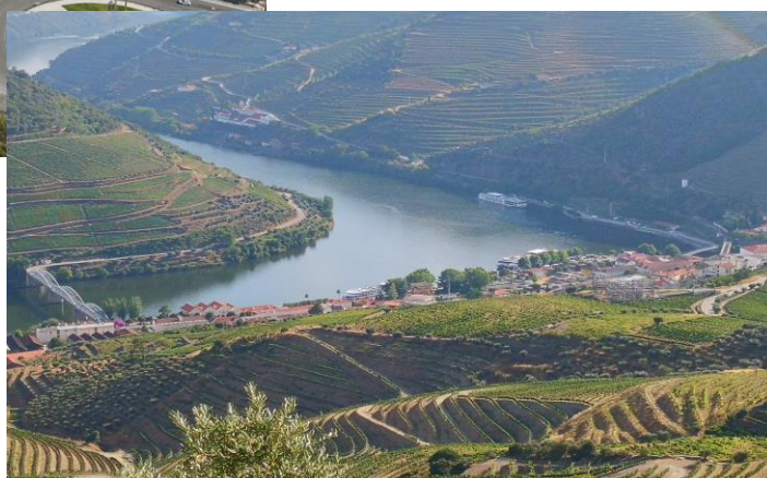
Figura 2 – Vila do Pinhão