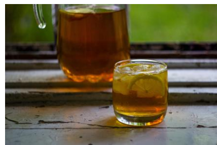
Figura 2. Bebida fria Dedasin https://pixabay.com )

Considera que tens 2 chávenas, uma com uma bebida quente outra com uma bebida fria. (Se quiseres podes fazer a experiência em casa)