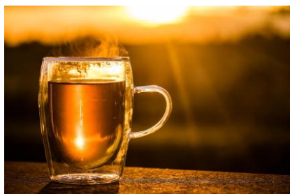
Figura 1. Bebida quente