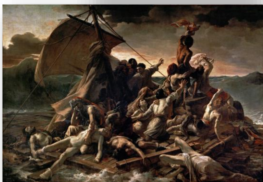
Imagem 2: Théodore Géricault (1818). A balsa de medusa. Museu do Louvre, Paris.