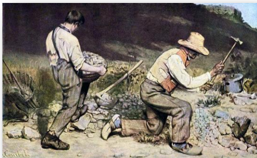
Imagem 4: Gustave Courbet (1849). Os quebradores de pedra. Galeria neue Meister, Dresden.