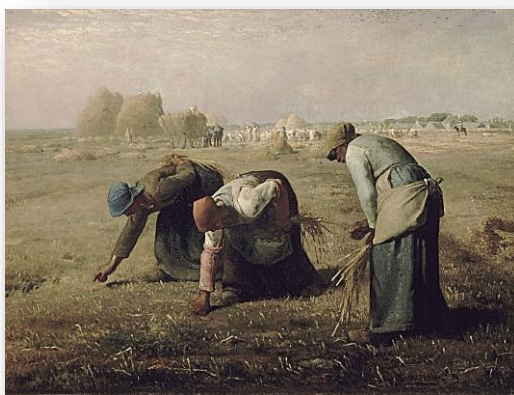
Imagem 5: Jean-François Millet (1857). Os respigadores. Museu d'Orsay, Paris.