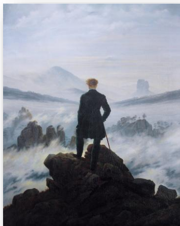
Imagem 1: G. D. Friedrich, (1818). Andarilho acima do mar de nevoeiro. Museu de arte de Hamburgo.