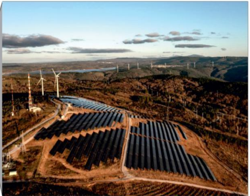
Figura 3: Parque híbrido do Sabugal.