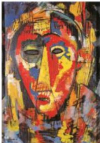
A. A Máscara de Olho Verde , de 1915 (expressionista)