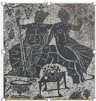
Figura 1 – Casa de Baco e Ariana (pormenor), Século I a.C., Óstia, Itália