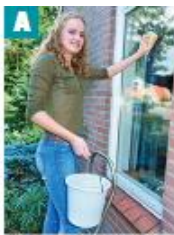
die Fenster putzen