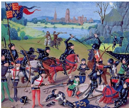
Doc. 1 - A Batalha de Azincourt 1415 no norte da França